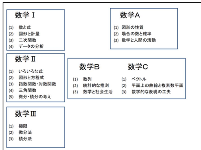
図1：次期学習指導要領での科目と配置（岡本氏作）

上記のように、4回は現在の学習指導要領下でのテストであるので、テストの構成について注目されるのは、2024年度以降であろう。ご存知の通り、次期学習指導要領では、「ベクトル」が数学Bから数学Cに移行する。このため、現在と同じテスト構成であれば、「ベクトル」を学習することなく入学してくる学生が文系を中心に増えるのではないかという懸念の声をしばしば耳にする。そこで、試験科目の構成についてパネルディスカッションで取り上げ